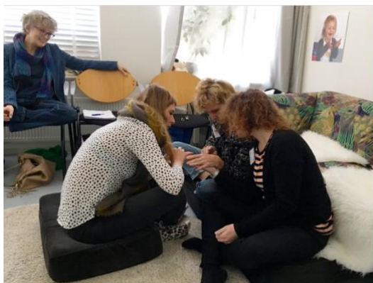
Foto: er wordt veel op elkaar geoefend om vertrouwd te raken met de Theraplay activiteiten en de nabijheid.

Dit deel bestaat uit 4 opleidingsdagen die achter elkaar gegeven worden. Je maakt kennis met de Theraplay methode en als deelnemer word je voorbereid op het gebruik van de basisprincipes in je eigen praktijk/werkomgeving. Na deze dagen beheers je Theraplay activiteiten op een beginnend niveau en ben je je bewust van de andere, unieke rol die je met Theraplay inneemt ten opzichte van je cliënten. Je hebt kennis gemaakt met de MIM, onze observatiemethode van de ouder-kind interactie. De 4 dagen dienen als voorbereiding op deel 2, waarbij je daadwerkelijk aan de slag gaat met 'elementen van de Theraplay methode' in je eigen werkomgeving.