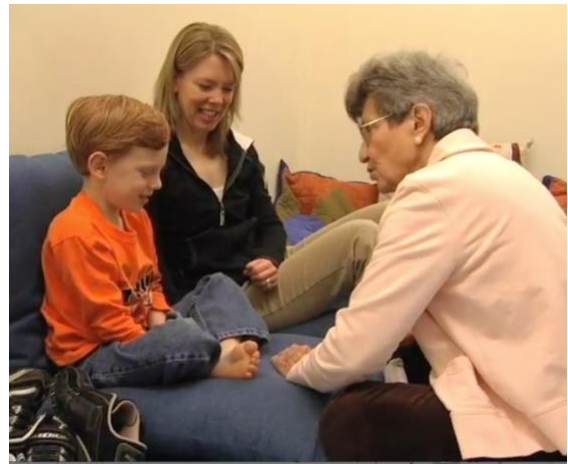
Foto: mede oprichtster van The Theraplay Institute, Phyllis Booth in actie.

Bij Theraplay ligt de focus op het veranderen van de patronen in de gezinsinteractie, die vaak mede-oorzaak zijn van gedragsproblemen bij kinderen.